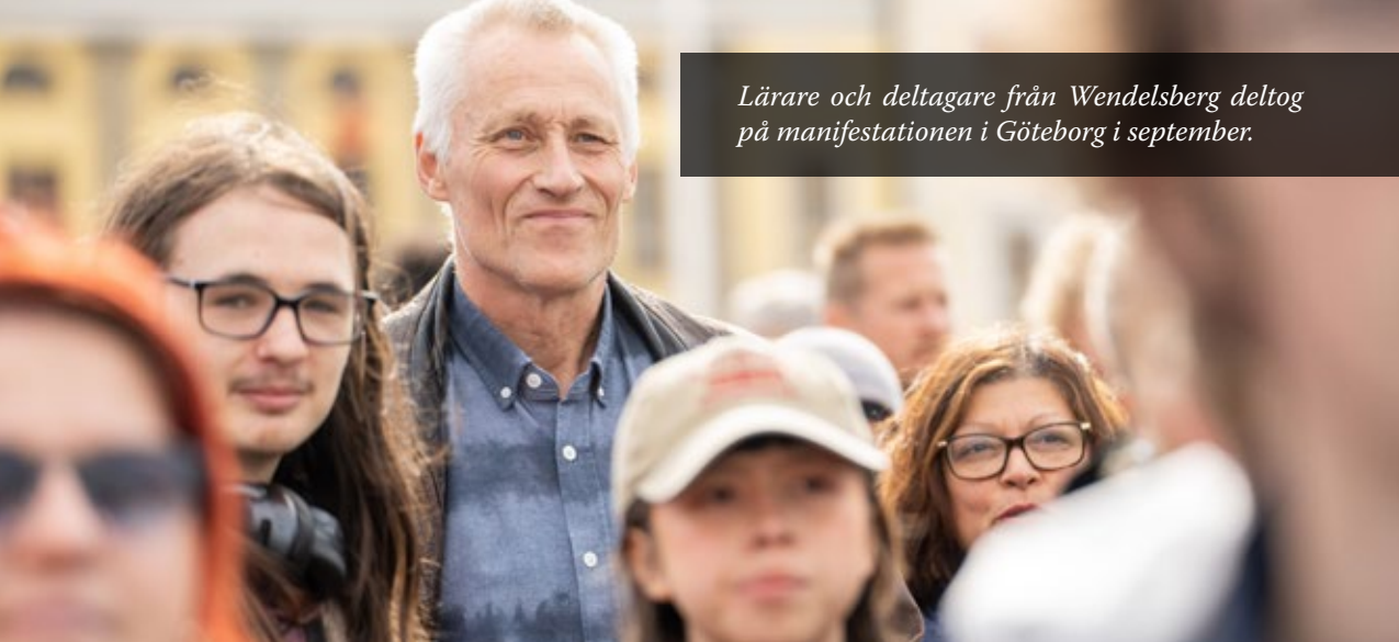
Lärare och deltagare från Wendelsberg deltog på manifestationen i Göteborg i september.