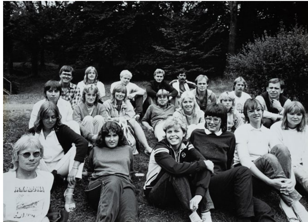
FL 2 83/84 (bilden tagen på kanothajken i 1:an).