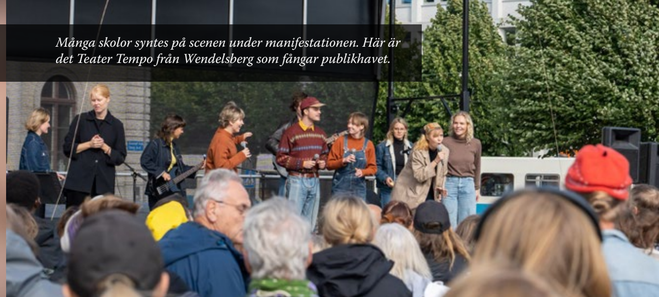
Många skolor syntes på scenen under manifestationen. Här är det Teater Tempo från Wendelsberg som fångar publikhavet.