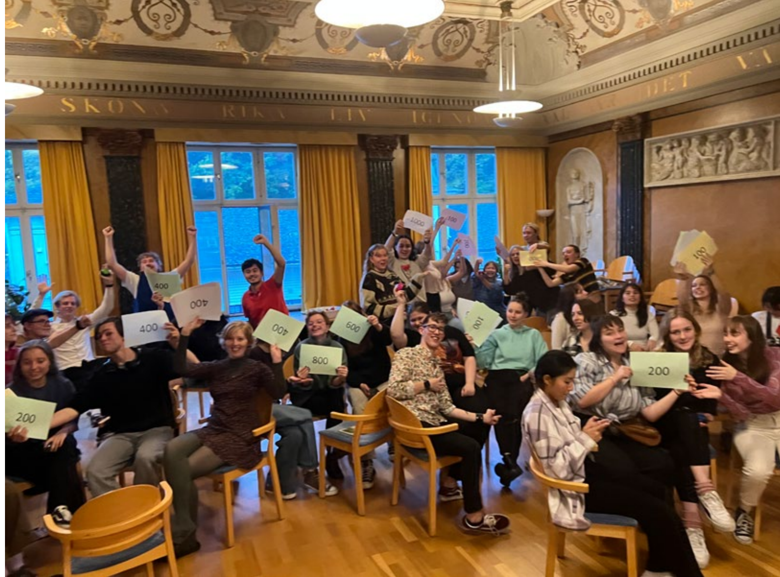
Glädjen och entusiasmen var stor när internatkamraterna tävlade i Boperdy.

Några av kvällens teman var Gissa låten, Disney, Göteborg, Filmmusik och Wendelsberg. Varje lag hade också blivit tilldelad en buzzknapp som blinkade och lät som man använde när man ville svara. Hysterin kunde börja! Flera lag var snabba på sina knappar och ett flertal gånger fick man fel i sitt svar då man glömde svara som en fråga. Efter 20 olika frågor och svar trodde man att aktiviteten var slut. Men