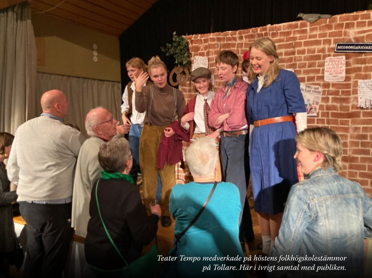
Teater Tempo medverkade på höstens folkhögskolestämmor på Tollare. Här i ivrigt samtal med publiken.