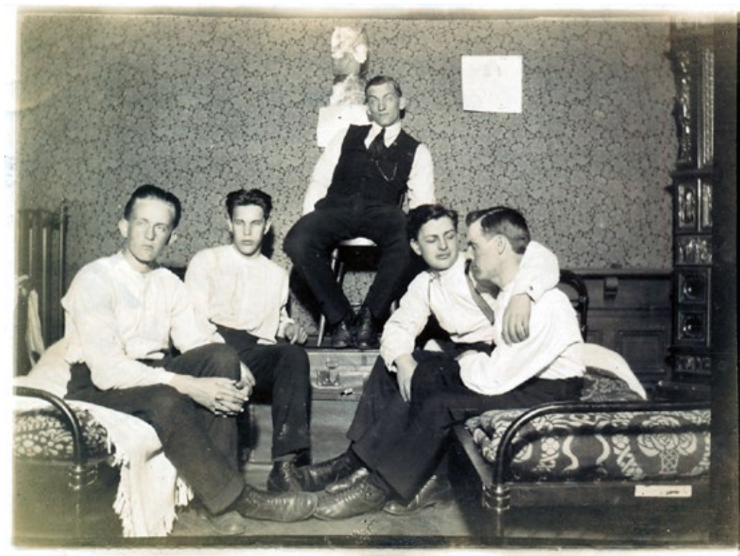
Wendelsbergskamrater från vinterkursen 1922-23 då biblioteket användes till internat.

På folkhögskoletiden, men före ombyggnaden, såg biblioteket ut på detta vis. Till höger om kakelugnen finns dörren ned till Wendels kas-savalv och vinkällare. Dörren finns inte kvar