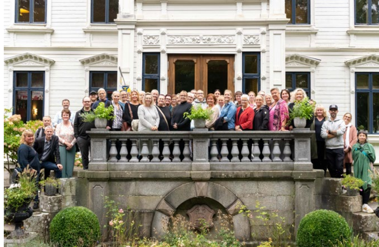
Många folkhögskolor som vill delta för att tala om internatets framtid när det bjöds in till konferens på Wendelsberg.

Praktiskt taget alla folkhögskolor med internat sitter i samma båt vad gäller ekonomin vilket under lång tid framförts till de som skulle kunna tillföra mer pengar in i systemet men utan resultat. I oktober samlades därför ett 40-tal